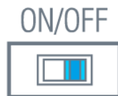
Рис. 1 - Терминаторы интерфейсов RS-485

На всех остальных устройствах работающих в той же сети RS-485 согласующие резисторы должны быть отключены.